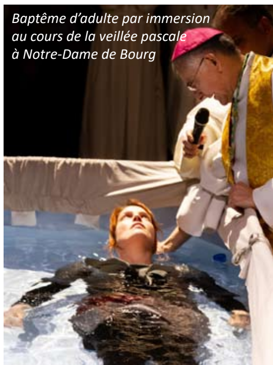
Baptême d'adulte par immersion au cours de la veillée pascale à Notre-Dame de Bourg

Message pour la Semaine Sainte diffusé sur RCF le 19 avril 2019