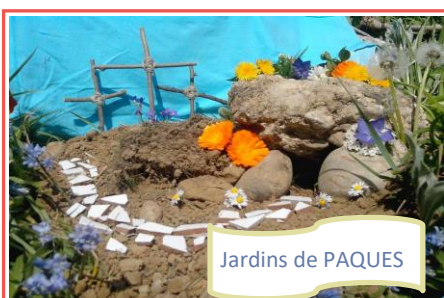
Jardins de PAQUES

Retrouvez toutes les photos des événements paroissiaux sur le site internet de la paroisse : Photos paroisse