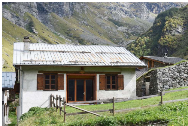
Grand chalet Jean Fournier - La Gurratz