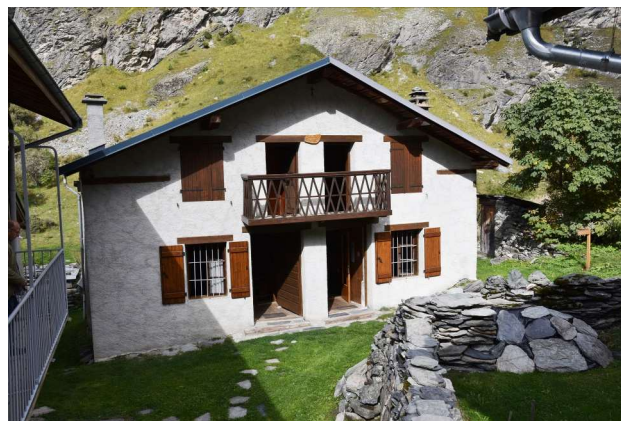
Petit chalet Jean Fournier - La Gurratz

Les deux chalets sont équipés en gaz butane. Il n'y a pas l'électricité, l'éclairage est assuré par des lampes à gaz. Chaque chalet dispose d'un réfrigérateur à gaz et d'une cave fraîche.